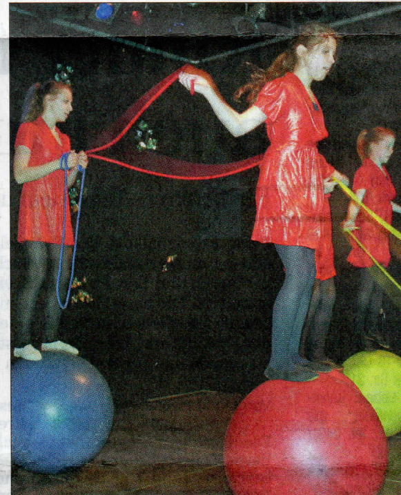
Seilhüpfen auf dem Ball? Kein Problem für geübte Dozenten.

spickt mit artistischen und emotionalen Höhepunkten. So oder so ähnlich wird es auch voraussichtlich bleiben. Auch wenn Beppolino ohne Hans Jäger irgendwie gar nicht vorstellbar ist, macht